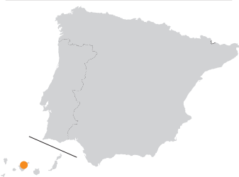
Puerto de Santiago: 10 m

De Pico del Teide (3718 m) op het Canarische Eiland Tenerife is de hoogste berg van Spanje. De markante kegelvorm van de slapende vulkaan ligt centraal in het spectaculaire Parque Nacional del Teide. De meest recente uitbarsting van de vulkaan was in 1909. Je kunt de berg vanaf vijf verschillende vertrekplaatsen beklimmen, maar steeds eindig je op de TF-21, die door een fascinerend vulkaanlandschap voert. Vanuit Puerto de Santiago stijgt de weg snel naar Tamaimo (545 m). Daarna loopt de klim tussen begroeiing geleidelijk op. Je passeert Chio, de restaurants El Estrecho (1430 m) en Las Cuevitas (1680 m) en fietst dan